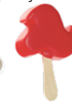
Ice cream crest